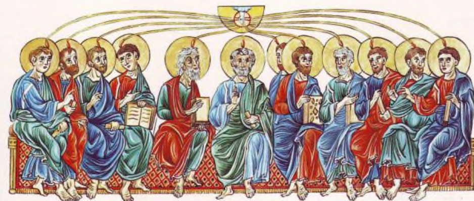
Dies Pentecostes i adventu Spiritu Sancti sup discipulos

einen sinn in meine unvernunft etwas balsam in meine wunden grenzenlose weite für meine toleranz lebenslängliche geduld im wandel des lebens einen funken ewigkeit in unsere vergänglichkeit *